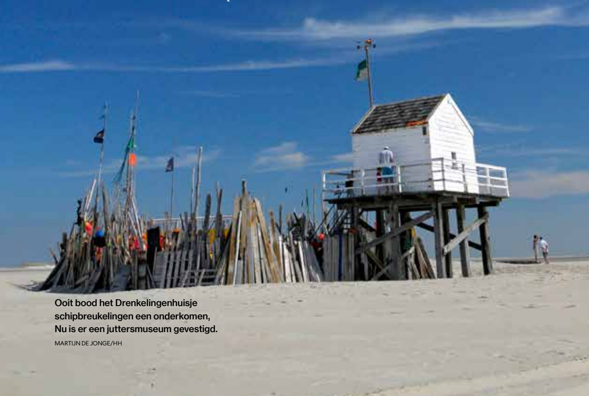
Ooit bood het Drenkelingenhuisje schipbreukelingen een onderkomen, Nu is er een juttersmuseum gevestigd.

Maar is het gebulder van de straaljagers verstomd, dan neemt de rust weer bezit van de zandplaat. Op de westpunt van de Vliehors staat een drenkelingenhuisje. Dit bouwwerk op palen was ooit een toevluchtsoord voor zeelui in nood die zo het vege lijf konden redden. Er is nu een klein juttersmuseum in gevestigd, en sinds een paar jaren fungeert het ook als trouwlocatie. Vanaf hier is het een stukje lopen naar de Robbenbol, waar op de zandplaten vaak zeehonden liggen en je 's avonds in de verte de vuurtoren van Texel kunt zien oplichten. De stilte, de uitgestrektheid, de einder in de verre verte; geen betere plek om de essentie van de Wadden te beleven.