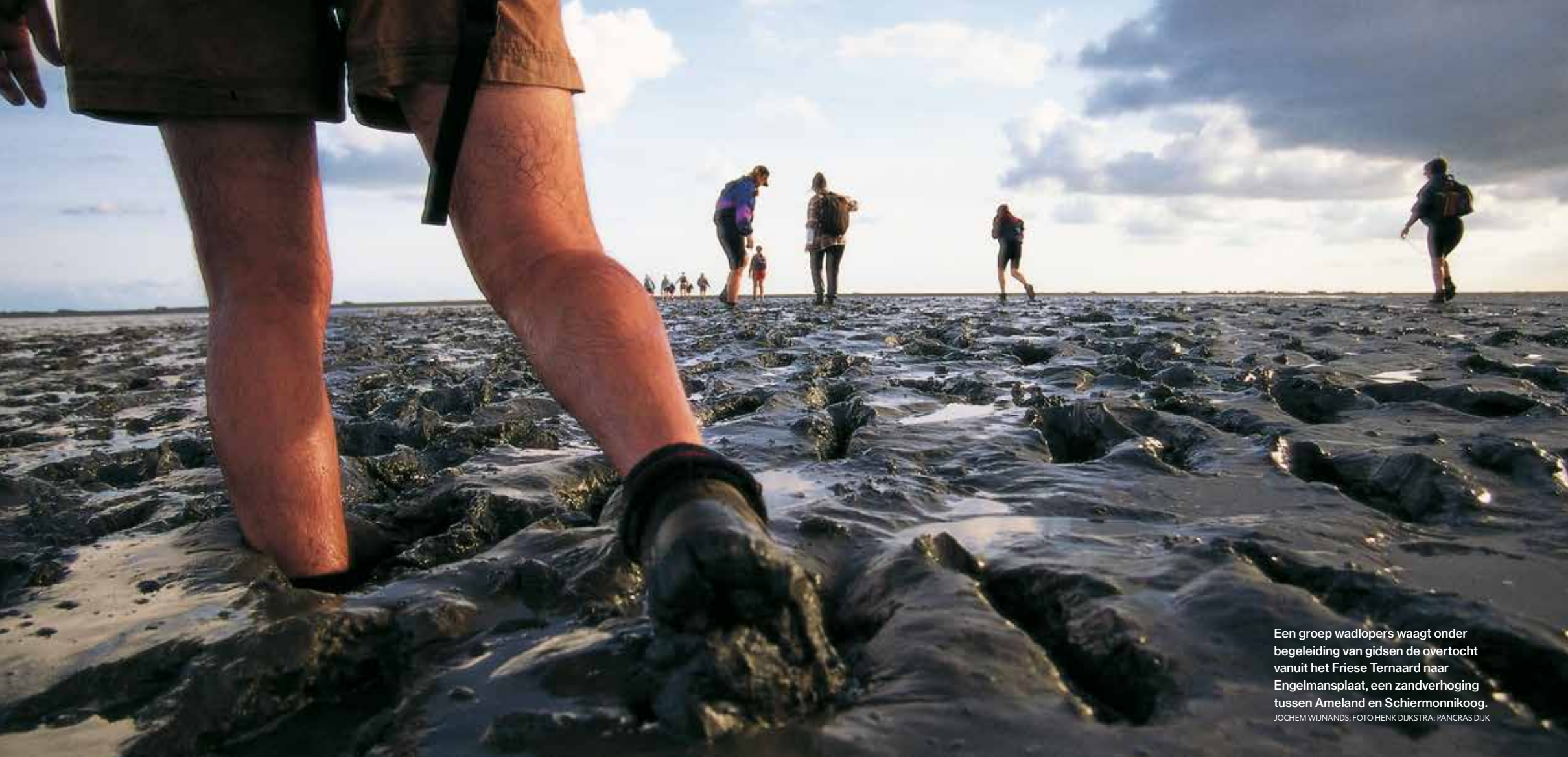
Een groep wadlopers waagt onder begeleiding van gidsen de overtocht vanuit het Friese Ternaard naar Engelmansplaat, een zandverhoging tussen Ameland en Schiermonnikoog.

JOCHEM WIJNANDS; PANCRAS DIJK